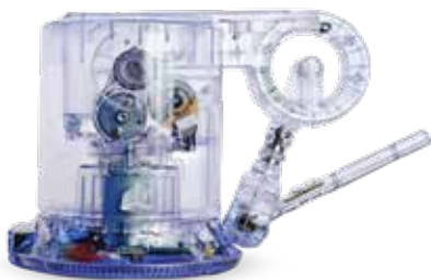
Touch 触觉式力反馈设备的功能测试和装配检查, 具有一流的透明度

采用超高速打印技术实现大规模生产运行和超凡效率。可快速互换的打印材料输送装置保持机器正常运行, 以将您的部件推进到制造工作流程, 而 3D Connect 服务则提供主动式和预防性的支持。