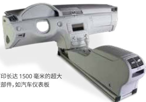
打印长达 1500 毫米的超大型部件, 如汽车仪表盘

ProX 800 和 ProX 950 SLA 打印机可构建具有卓越表面平滑度、分辨率、边缘清晰度和容差的部件。这两款打印机提供适合所有 3D 打印机的种类齐全的材料且工作效率高, 能够最大限度减少材料浪费, 维持较低的总拥有成本。再加上 3D Systems SLA 打印机拥有的卓越生产效率和可靠性, 无疑将成为专业服务机构的优选产品之一。